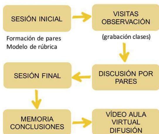
Figura 2. Esquema del procedimiento seguido durante el proyecto de revisión por pares.

Más tarde, se llevó a cabo la discusión por pares siguiendo las rúbricas y las anotaciones realizadas durante las observaciones; en primer lugar por parejas y, después, en una sesión final, por el conjunto del profesorado participante. Las conclusiones obtenidas se recogieron en una memoria y se procedió a la grabación de un video de difusión en el que han participado tanto profesorado como estudiantes. La Figura 2 recoge un esquema del procedimiento seguido.