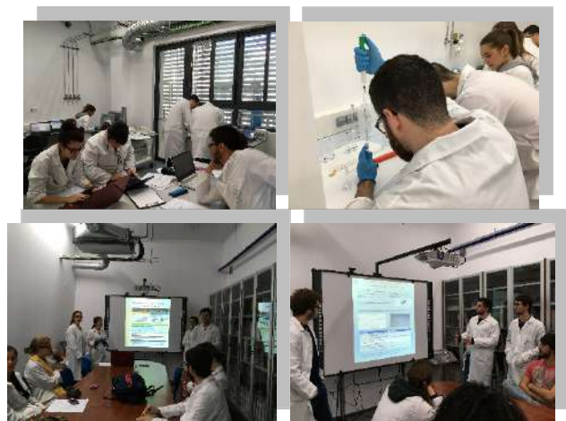
Figura 2. Alumnos de la asignatura Química Analítica III durante el desarrollo de cada una de las etapas de la metodología científica llevadas a cabo en la práctica de laboratorio.

De esta forma, durante el desarrollo de la práctica de laboratorio, se le proporciona al alumno la posibilidad de realizar las etapas principales de la investigación bajo la supervisión del profesor, llevando a cabo búsquedas bibliográficas de artículos científicos, el desarrollo de la parte experimental de la práctica, el tratamiento estadístico de los datos, la interpretación y exposición de resultados y la obtención de conclusiones. Las bases bibliográficas consultadas, la capacidad de trabajo en equipo, el conocimiento de la técnica instrumental, la interpretación y síntesis de la información, la presentación de los contenidos y resultados en formato póster, la clara exposición oral de los resultados experimentales, así como de las conclusiones obtenidas, y la correcta defensa de las cuestiones, son las competencias evaluadas in-situ por el profesor responsable.