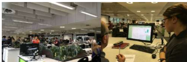
Figura 1. Imágenes de una sesión de prácticas en el "Central Teaching Laboratories" de la Universidad de Liverpool.

La metodología de enseñanza aplicada en este centro implica que el alumno juegue un papel de investigador llevando a cabo la metodología científica desde el comienzo hasta la finalización de la práctica. Las sesiones de laboratorio tienen una duración de 7 horas donde cada grupo de alumnos (5-6 alumnos/grupo) debe desarrollar la parte experimental de la práctica de laboratorio de manera independiente bajo la tutorización del profesor. Sus resultados los exponen el mismo día en formato póster al profesor responsable, tal y como harían en un congreso de investigación o una reunión de empresa. Esta metodología docente se caracteriza por favorecer el trabajo en equipo, la interpretación y síntesis de datos e información química, y la capacidad para comunicarse fluidamente de manera oral y escrita promoviendo el desarrollo de la parte experimental de una forma más autónoma (Figura 1).