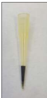
Figura 3. Unidad de microextracción desarrollada sintetizando un monolito de nanocuernos de carbono en el interior de la punta de pipeta.

nanopartículas, las cuales polimerizaron al irradiar la mezcla con luz ultravioleta, formando una estructura sólida continua. Todo este proceso, se llevó a cabo en el interior de una punta de pipeta, obteniendo la unidad de microextracción que se muestra en la Figura 3, la cual se usó para la extracción de parabenos en muestras de orina.